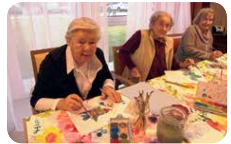
Malen im Seniorenhaus

Da fällt mir doch noch etwas ein: Im April haben wir uns mit einem Büchertisch und einem Glücksrad am Straßenfest zur Eröffnung der neuen Horneburger Mitte beteiligt.