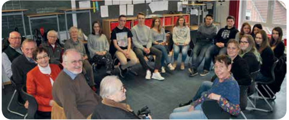
Dialog mit Oberschülern

Ein quirliger Verein sind die Horneburger „Methusalems“, die sich zur Aufgabe gestellt haben, sich im Seniorenalter gegenseitig zu helfen. So lange wie möglich selbstbestimmt in vertrauter Umgebung leben zu können, das ist die Grundidee. Die stattliche Zahl von 787 Hilfeinsätzen im Jahr 2017 belegt den Erfolg! Auch 2018 sind die „Methusalems“ stets hilfsbereit im Einsatz für ihre Mitglieder. Dabei kommt das gesellige Miteinander keineswegs zu kurz. Gemeinsame Ausflüge und Exkursionen, Spaß beim Skatkloppen oder im langjährigen Literaturkreis, informative, unterhaltsame Stammtischabende sowie persönliche Beratung während der monatlichen Sprechstunde sind Garanten für ein lebhaftes, vertrauensvolles Vereinsleben. Doch dass die „Methusalems“ auch über den Tellerrand schauen können und sich nicht nur mit sich selbst beschäftigen, beweist das Projekt „Die Kriegsgeneration im Dialog mit Horneburger Oberschülern“. In Form eines Gesprächskreises geht es uns Senioren nicht darum, uns gegenseitig unsere Kriegstraumata vorzujammern. Nein – wir haben in Kooperation mit der Horneburger Oberschule und im Dialog mit den 10.-Klässlern unsere Kriegserfahrungen reflektiert und in die heutige Zeit mit ihren weltweiten Konflikt-herden und der Zunahme rechtspopulistischer Tendenzen transferiert. Dieses von „Methusalem“ initiierte Projekt war so erfolgreich, dass es auch im Jahr 2018 fortgesetzt wird. Auch im 11. Jahr der Vereinsgeschichte haben die „Methusalems“ nichts von ihrem Elan und ihrer